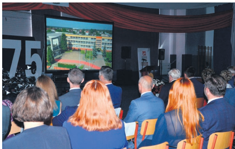
ZDJEK TO BIERUN

Warto podkreślić, że to międzypokoleniowe spotkanie absolwentów z uczniami, z dawnymi i obecnymi profesorami, z koleżankami i kolegami z dawnych szkolnych lat, przypominało wielki zjazd rodzinny. (red.)