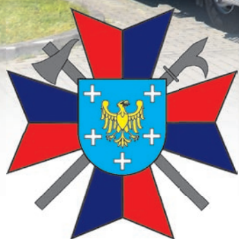
Order Okolicznościowy z okazji 25-lecia Oddziału Powiatowego Związku OSP RP