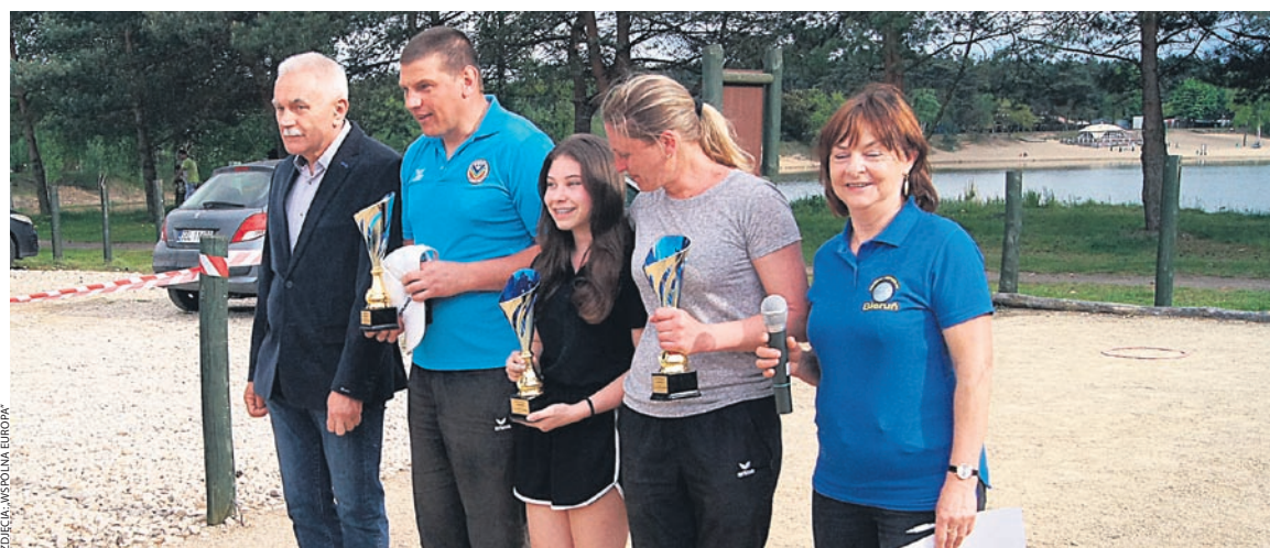
ZDJĘCIA: WSPÓLNA EUROPA