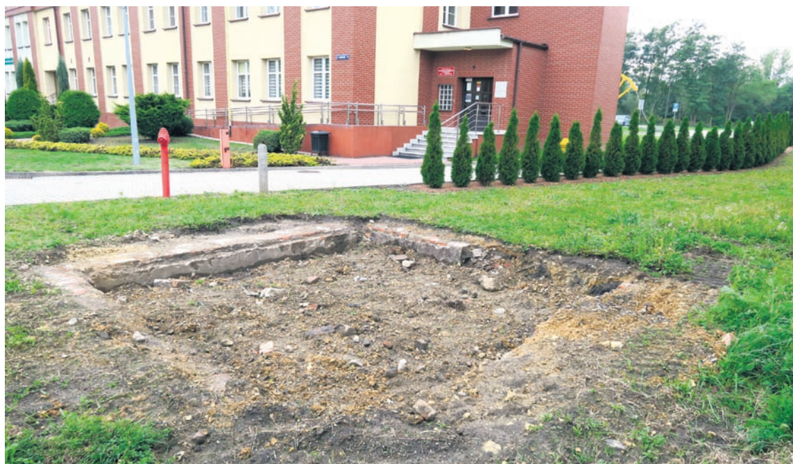
Szyb zlokalizowany przy ul. Łędzińskiej 24.

Pół wieku później powstała na tzw. Kępie, nowa kopalnia „Heinrichsfreude II”, którą w latach dwudziestych XX wieku przemianowano na kopalnię „Piast” w Łędzinach. Funkcjonowała ona do 1972 roku, kiedy włączono ją w struktury nowej