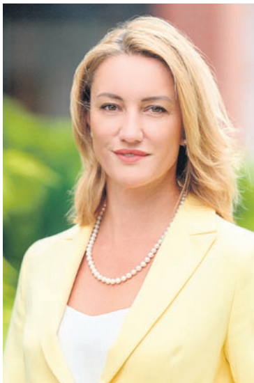
ZDJEŃCE P. SWIEŚ

„ROZWIJAMY POTENCJAŁY – Powiatowy Program Transformacji Pokoleniowej” to projekt realizowany przez Powiatowe Centrum Pomocy Rodzinie, którego głównym celem jest zbliżenie ludzi do siebie, zachęcenie do wspólnego działania na rzecz lokalnej społeczności i odbudowa